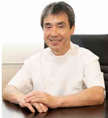
医療法人 松尾会 松尾病院 理事長