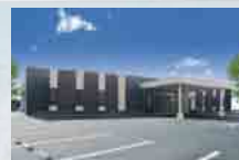
さがみ典礼 神栖ホール