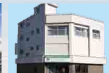
さがみ典礼 ひたちセレモニー