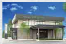
さがみ典礼 日立ホール