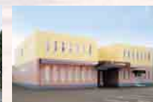
さがみ葬斎会館 古河