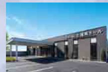
さがみ典礼 土浦南ホール