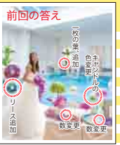
写真:ベルヴィ郡山館(福島)