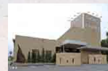
ジャクセン さがみ典礼