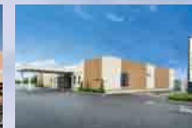
さがみ典礼 石岡西ホール