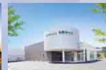
さがみ典礼 鉾田ホール