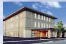
さがみ典礼 土浦ホール