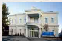
さがみ典礼 結城ホール