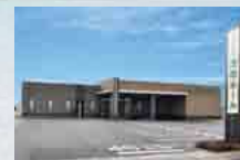
さがみ典礼 波崎ホール