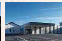
さがみ典礼 筑西ホール