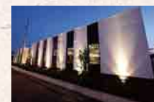
さがみ典礼 古河鴻巣ホール