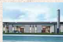
さがみ典礼 鹿嶋ホール