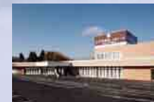
さがみ典礼 石岡ホール