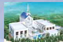
フランベルアムール