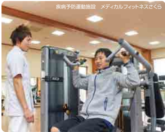
疾病予防運動施設 メディカルフィットネスさくら

■ 脳卒中のリハビリテーションの種類 脳卒中のリハビリテーションでは主に歩くことが困難になる(歩行障害)、腕の麻痺により日常生活が困難になる(上肢機能障害)、言葉や飲み込みの障害(言語障害、嚥下障害)、記憶や集中力の低下(高次脳機能障害)などを対象とします。当院では例えば歩行障害では、自力で全く歩けない方に対しては、専用の機械で身体を支えて行う部分免荷式トレッドミルトレーニング(BWSTT)というリハビリや上肢機能障害に対しては促進反復療法や電気刺激療法といった麻痺の改善を促すためのリハビリなども取り入れて実施しております。