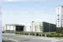
さがみ典礼 龍ヶ崎ホール