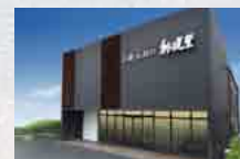
さがみ典礼 大みか