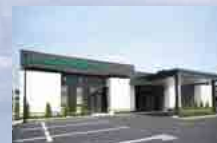
さがみ典礼 龍ヶ崎西ホール