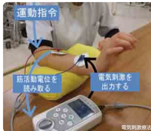
運動指令 電気刺激を出力する 筋活動電位を読み取る