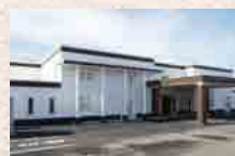
さがみ典礼 古河三杉ホール