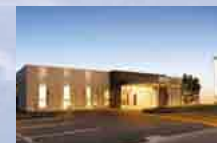
さがみ典礼 牛久ホール