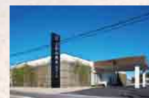
さがみ典礼 境ホール