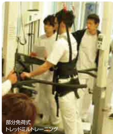
部分免荷式 トレッドミルトレーニング

■ 脳卒中の発病予防 再発予防に向けて 脳卒中において予防が重要であることは言うまでもありません。脳卒中は肥満や高血圧、脂質異常症、糖尿病などいわゆる「メタボリックシンドローム」が発病リスクの一つと言われております。通常、検診などで指摘されたり、指導を受けたりすることは多いかと思いますが、最も重要なことは運動の機会を確保することです。当院では疾病予防運動施設を平成27年1月より開設して、医療機関が運営する運動施設を始めました。ここでは、理学療法士や健康運動指導士など運動の専門家が常駐しており安心かつ効果的なアドバイスが誰でも受けられます。また、28年4月より指定運動施設法の認可を受け、生活習慣病の方が医師からの運動処方をしてもらうことで、会費自体が医療費控除の対象となります。大きな病気につながる前に是非一度ご相談下さい。