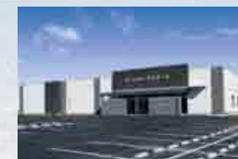
さがみ典礼 行方ホール